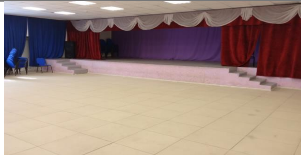
4. Обеденный зал (столовая, буфет)